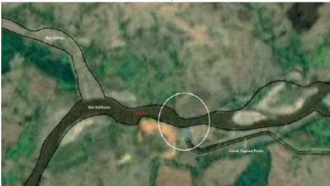
Esquema general sistema de tabique y localización de la presa