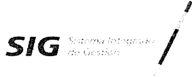
TABLA DE VALORACIÓN DOCUMENTAL FONDO PARA EL FINANCIAMIENTO DEL SECTOR AGROPECUARIO - FINAGRO